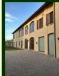
Villa Concordia ROBBIATE